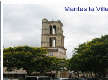
Mantes la Ville