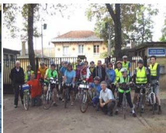
La première Nocturne Bellevilloise d'Automne