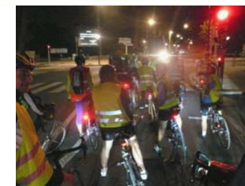
Cyclos et Voie Lactée