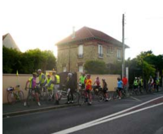
Pause après la côte de Sucs

Pour sa première édition l'organisation de la Nocturne est grandiose. D'abord la météo est favorable avec un clair de Lune au programme. L'accueil à la Cipale, dans les locaux du Paris Cycliste Olympique est toujours magique pour les passionnés de bicyclettes. Les Bellevillois procèdent aux inscriptions et à la vérification des éclairages et des gilets fluorescents. Des fanions embellissent les vélos des 4 Capitaines de Route.