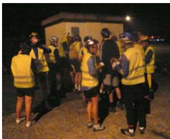
2 e ravitaillement à Gouvernes