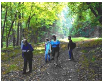
Les Marcheurs dans la Forêt de Monceaux