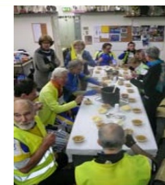
Minuit, la Soupe à l'Oignon