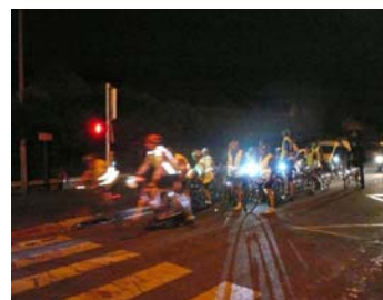
Du côté de Champs-sur-Marne