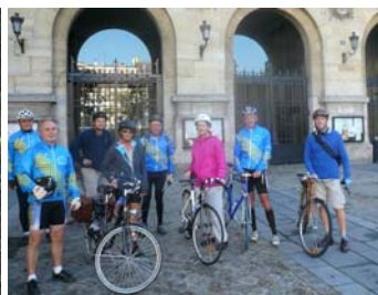
Escapades Bellevilloises du Forum des Associations