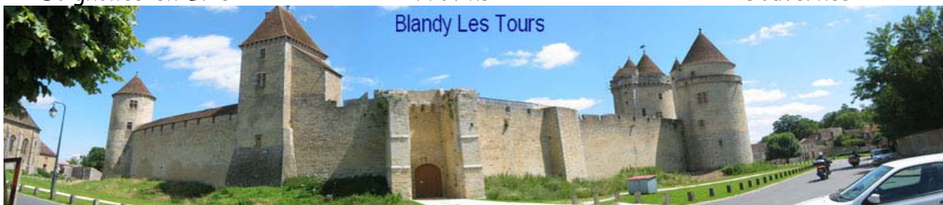
Blandy Les Tours