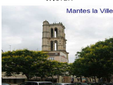
Mantes la Ville